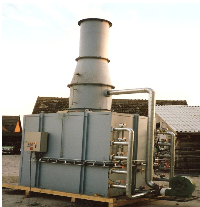
Turnkey levering – Fremstilling af stål casing, ildfast foring, gas og styring—koldtestet og udtørret inden aflevering til kunden.