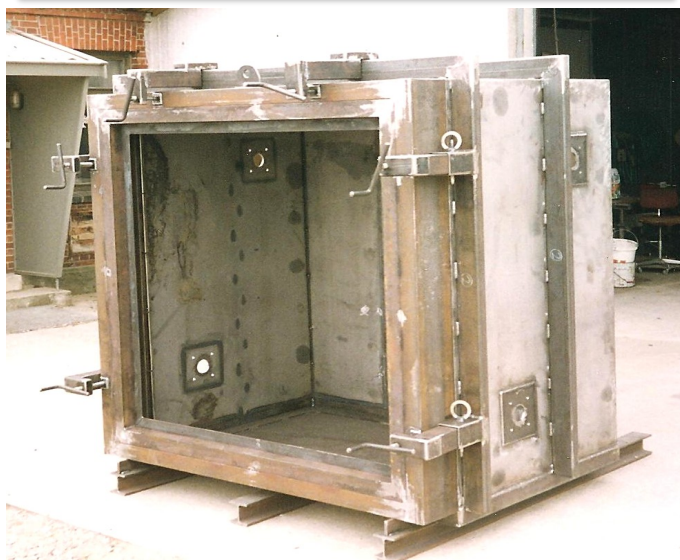
Stål Casing – Fremstillet til en af vores kunder, der selv udfører ildfast udmuring og montage.

Vi tilbyder også renovering, vedligeholdelse og årlige service på eksisterende ovnanlæg